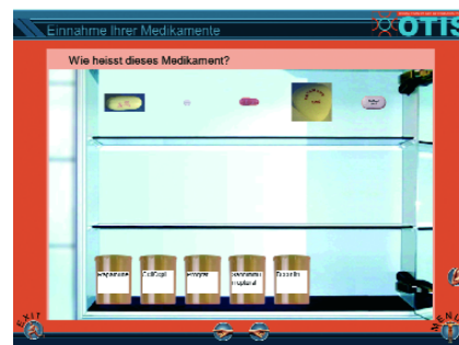
Abb. 2 Interaktive Übung zum Kennenlernen der Medikamente aus dem Kapitel Transplantationsmedikamente